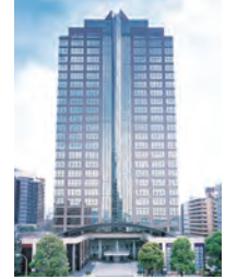
〈東京本社〉 西新宿三井ビルディング

事業内容 太陽光発電所システムの開発・販売・設置・工事 自社太陽光発電所の設置・保守 許可番号 建設業の許可: 国土交通大臣 許可 (特-30) 第 26779 号 宅地建物取引業: 国土交通大臣 (1) 第 9445 号 電話番号 TEL: 03-6911-0885 FAX: 03-6911-0881 フリーダイヤル: 0120-793-393 URL https://ymd-fresh.com/