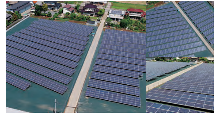
茨城県坂東市馬立