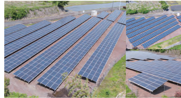
茨城県笠間市石井